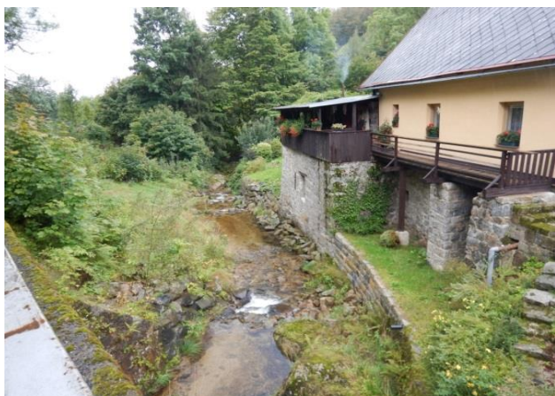
Pohled po vodě z mostku nad Jeřicí

Most přes Jeřici je dostatečně kapacitní. KB je však zároveň místem, kde tok začíná ohrožovat zástavbu místní části Na Pilách.