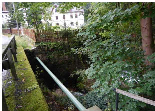
Pohled proti vodě z mostku nad Jeřicí